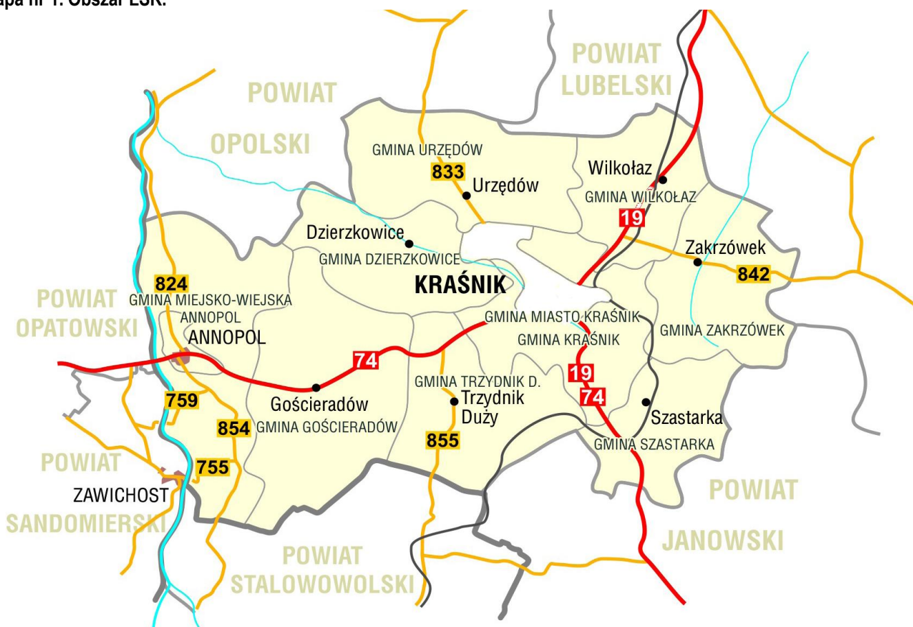
Mapa nr 1. Obszar LSR.